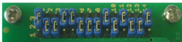
Pos. 1 ( MB96F336Y/MB96F338Y )