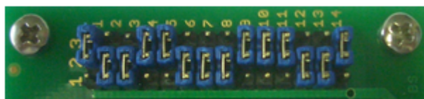
Pos. 2 ( MB96F336U/MB96F338U )