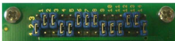
Pos. 3 ( MB96F378/MB96F379 )